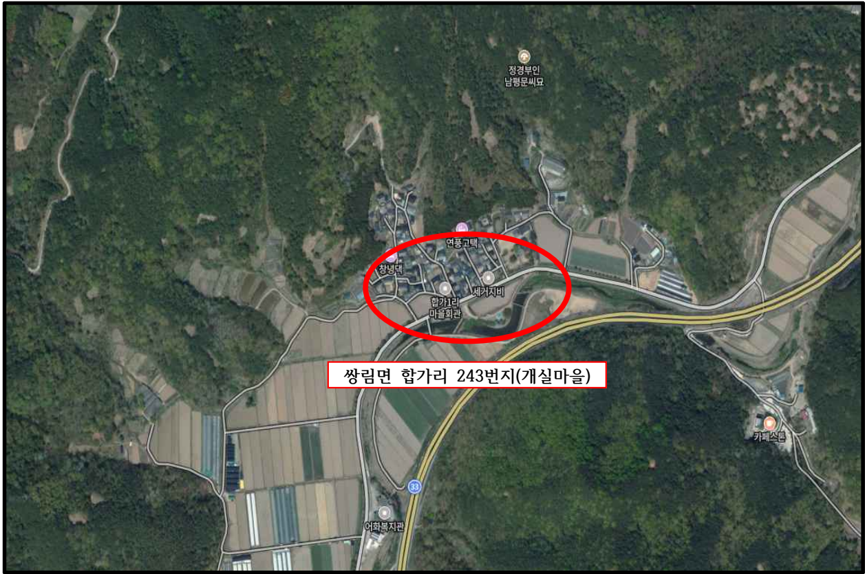
쌍림면 합가리 243번지(개실마을)